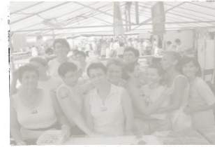
Dans les cuisines ça chauffe, et avec une vache de « tatoué » sur la peau, ça va tellement mieux.

d'après-midi du dimanche du sans doute à la grosse chaleur estivale, plus propice à la sieste qu'à la balade. Une fête bien organisée, avec différents pôles. Un village des métiers traditionnels où chacun pouvait visiter le savoir-faire des artisans, un coin fête foraine avec bien sûr des autos tamponneuses, vide-greniers tout autour et un coin repas sous des barnums pour protéger du soleil. Ceux qui n'étaient pas à la fête, c'était les bénévoles ! Pour eux le week-end fut harassant, mais ils ont su garder le sourire. La prochaine c'est dans un an, et ils sont tous prêts à recommencer.